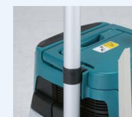
Comodo alloggiamento prolunga