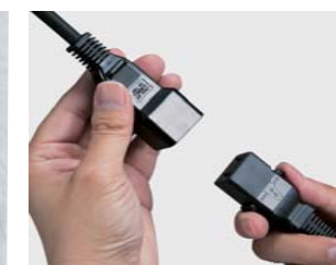
Cavo di alimentazione removibile