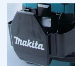
Porta accessori ampio e removibile