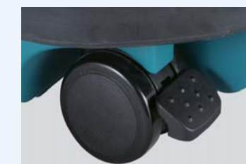
Ruote pivotanti con blocco freno