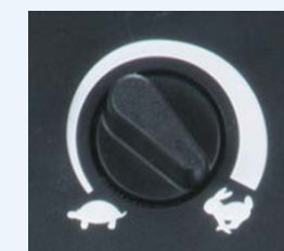
Variazione della potenza di aspirazione mediante potenziometro